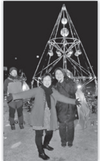
広場に作られた光のタワー

時がたつほどに心は落ち着くのだろうと思って過ごしてきました。しかし、見える景色は変われども多くの大切な命を亡くした言いようのない「こころ」のおきどころがまだみつきりません。何かをさぐるように、何かをつむぐように、沢山のの方々の支援を得ながらここまで来ました。内野株式会社様からの継続的なタオル支援には会う事のない見知らぬ私たちに無償の励ましと暖かなお気持ちがいっつも届いております。限りなく柔らかなタオルにつつまれ何度、涙と汗をぬぐった事でしょう。そして、これからも生活のかたわらにタオルを添え心の励みとして過ごします。