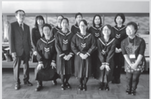
盛岡白百合学園高校合唱部員の方々と