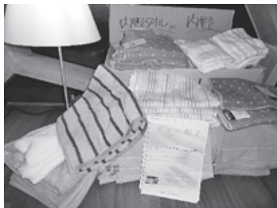
内野株式会社から被災地に届けられたタオルの一部

*脳腫瘍を患っている29才です。放射線治療が始まり副作用で髪の毛が抜けるとのことで、このタオル帽子と出会いました。これからの時期にピッタリなうすでのやわらかいピンクの帽子を頂きました。主人にもかわいいとほめられました。恥ずかしながら初めてタオル帽子の活動を知りました。とてもいい活動だと思います。本当に、心から感謝いたします。(宮崎県)