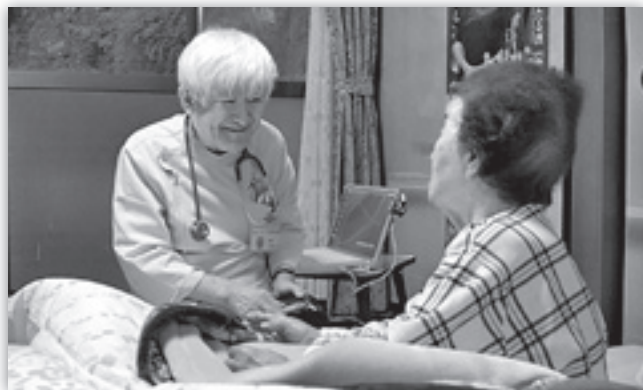
「四万十～いのちの仕舞い～」ワンシーン

総会終了後開催した「四万十～いのちの仕舞い～」上映会には 322 名の方が入場、改めて市民の方々の在宅医療に関する関心の高さを感じました。会場ロビーには当会会員によるがんについての相談コーナーや、手作り品バザーコーナーが設置され多くの来場者が利用しました。上映前には盛岡白百合学園高校の2年生部員が合唱を披露し、ステージから美しい歌声を響かせました。当日会場で行ったアンケート集計結果を以下にご紹介します。