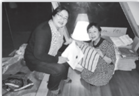
内野さんからのタオルを進呈

時がたつほどに心は落ち着くのだろうと思って過ごしてきました。しかし、見える景色は変われども多くの大切な命を亡くした言いようのない「こころ」のおきどころがまだみつきりません。何かをさぐるように、何かをつむぐように、沢山のの方々の支援を得ながらここまで来ました。内野株式会社様からの継続的なタオル支援には会う事のない見知らぬ私たちに無償の励ましと暖かなお気持ちがいっつも届いております。限りなく柔らかなタオルにつつまれ何度、涙と汗をぬぐった事でしょう。そして、これからも生活のかたわらにタオルを添え心の励みとして過ごします。