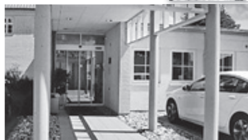
ホスピス正面玄関