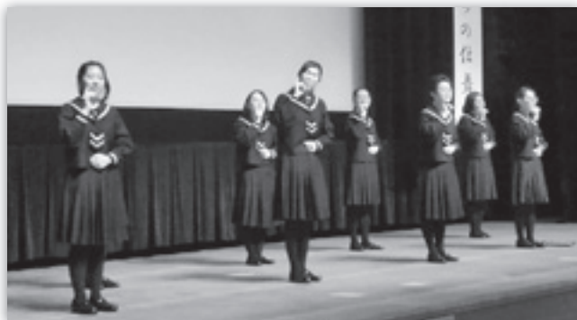
盛岡白百合学園高校合唱部員のステージ

①素晴らしい映画でした。先生の生き方、たくさんの言葉を頂きました。穏やかな先生、どうしてあの様に朝から一日中働けるのか不思議に思う位でした。是非、本も読んでみたいと思います。大変良い企画でした。ありがとうございました。(岩手県・女性)