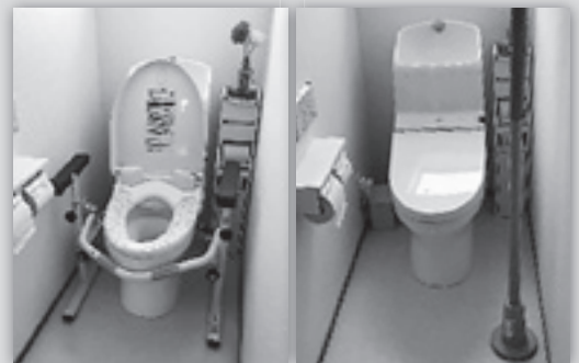
便器に挟み込む タイプの手すり

他職種の方々との連携を取りながら、これから関わりを持たせていただくお客様へ親身に向き合える立場でありたいと考えています。